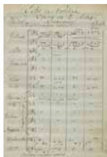
Écho et Narcisse, Ouverture

Les scènes mythologiques semblent poussiéreuses aux aristocrates parisiens. Cette aimable fable prône des valeurs dépassées telle que l'amour pur. Impossible de s'identifier à ces héros égoïstes et jaloux !